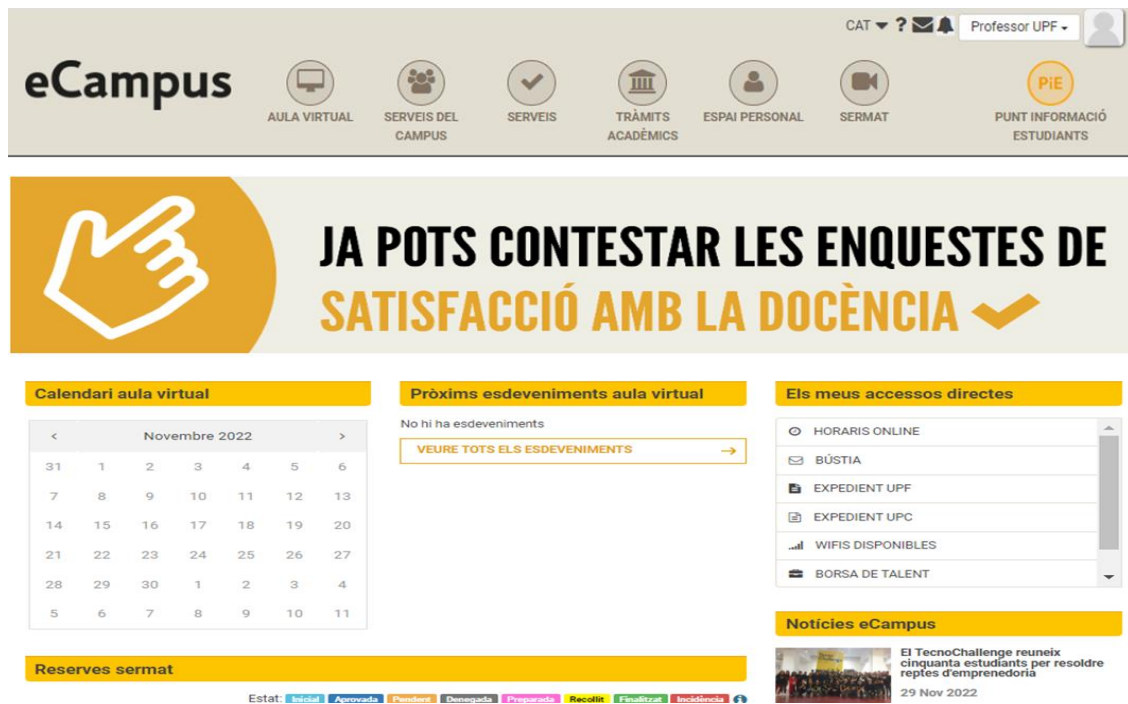
Figura 2. Intranet per a estudiants i professorat -eCampus-

Per al PDI i PAS també hi ha una Intranet específica, on disposen d'informacions diverses (normatives del TecnoCampus, actes de reunions, calendaris, informes de satisfacció, etc.), formularis per a la realització d'alguns tràmits (sol·licitud de cursos, instàncies, etc.) i una aplicació per a peticions relacionades amb serveis tècnics.