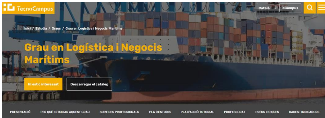
Figura 1. Pàgina web del Grau en Logística

Pel que fa als plans docents dels graus, es disposa d'una plataforma que gestiona les actualitzacions anuals, permetent l'edició per part dels responsables de les assignatures i els coordinadors fins que aquests últims els validen. Un cop validats, es tanca l'accés a la plataforma i es publiquen automàticament a la pàgina del pla d'estudis del grau i a l'aula virtual corresponent.